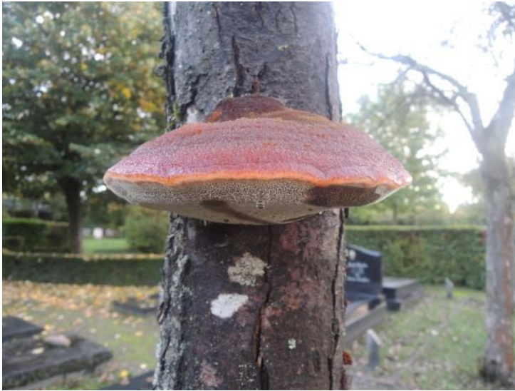
Op sierappel zag ik er een Boomgaardvuurzwam.

Samen met zoon en hond hebben we een flinke wandeling gemaakt in het Hagenven. Niet echt gezocht maar toch viel ons oog op een ferme Biefstukzwam en op een groepje Roodbruine schijnridderzwammen.